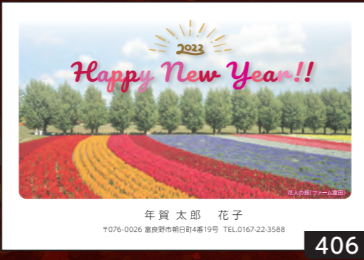
写真 下田 豊 中富良野町在住。北海道の四季、自然動物を撮り続けるカメラマン。雪の結晶や樹氷など、北国ならではの表情をつぶさに観察し撮影した写真が好評。自ら経営するログハウスレストランでポストカードとして販売し人気を集めている。