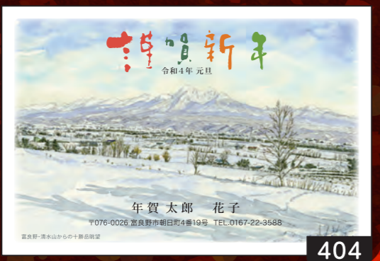
富良野市在住。北海道の美しい風景に魅せられ富山県より移住。以来、移りゆく四季の輝きを撮り続け、撮影写真は北海道の翼AIR DOやJR北海道の広告などにも起用される。愛好家向けの写真専門誌では作品や撮影記を発表。富良野、美瑛エリアの撮影ツアーのガイドも務める。