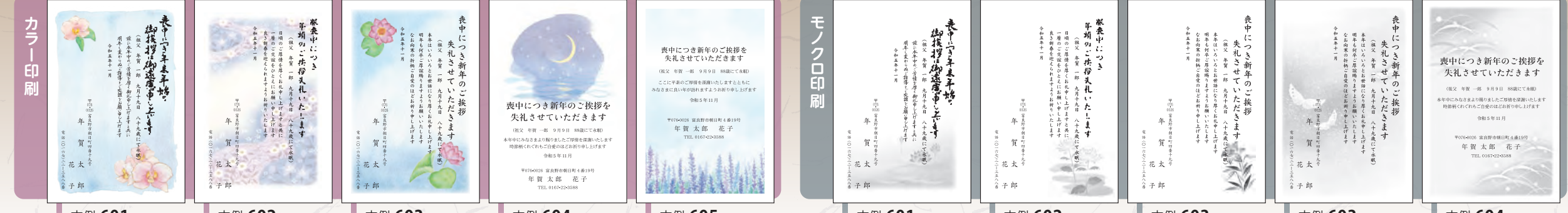
文例 601 カラー蘭 文例 602 カラー川 文例 603 カラー蓮 文例 604 カラー月 文例 605 カラーラベンダー 文例 601 モノクロ蓮 文例 602 モノクロ菊 文例 603 モノクロ百合 文例 603 モノクロ蝶 文例 604 モノクロ笹